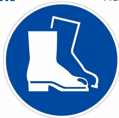
Feste Geschlossene, Trittsichere Schuhe